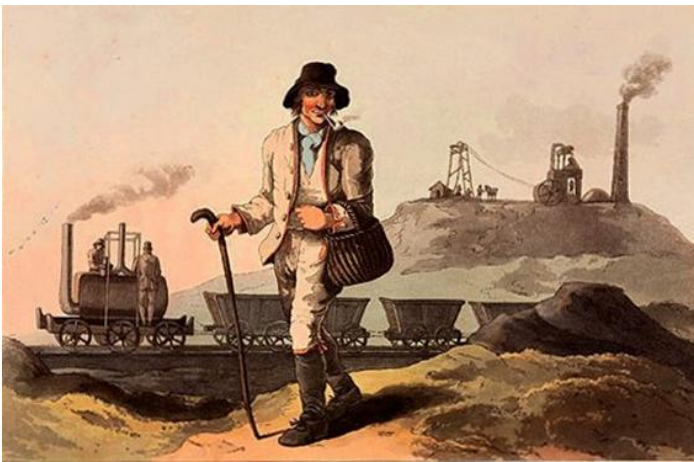
Englanti v. 1814